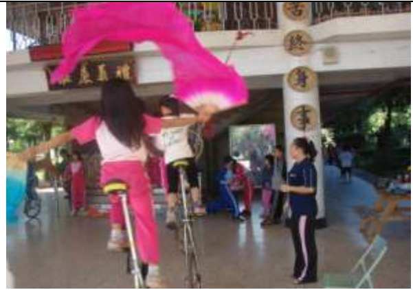
獨輪車舞台劇練習