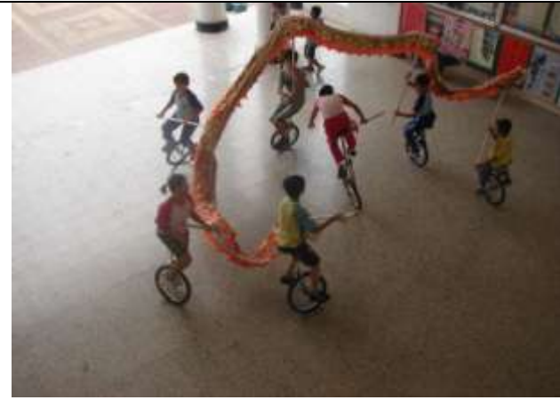
獨輪車舞台劇練習