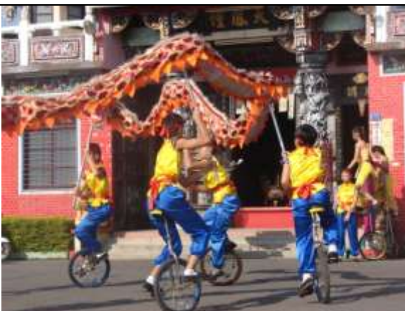
廣安社區關懷據點成立大會