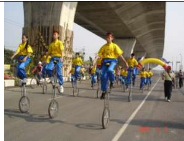
南二高自行車道啓用典禮