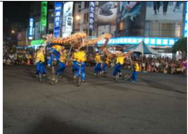
參加全國創意舞龍競賽獲第二名