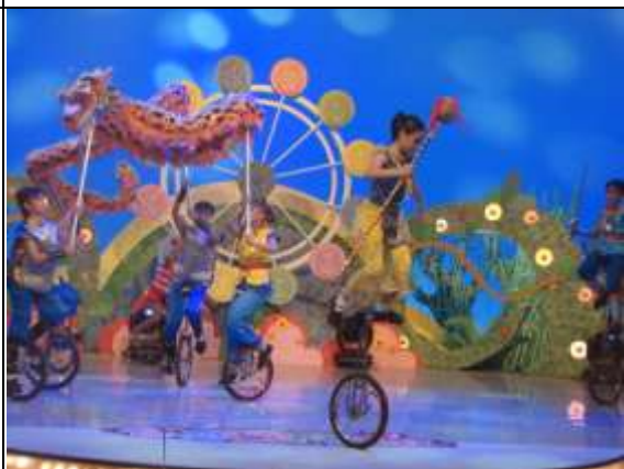
公共電視「台灣囡仔讚」節目錄影