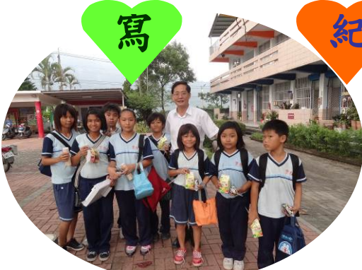
集5點閱讀點數換39元組合餐