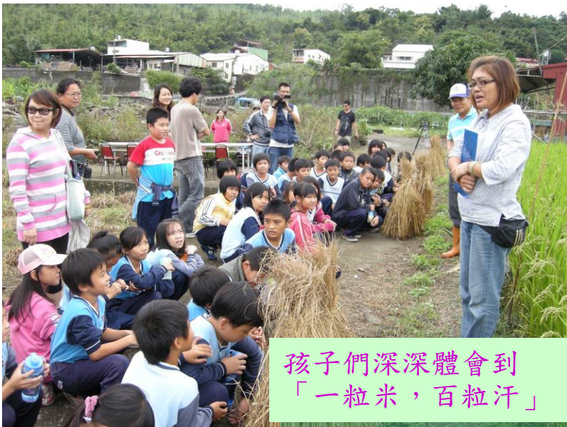
孩子們深深體會到 「一粒米，百粒汗」