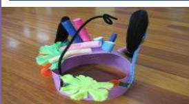
創意帽 幼稚園 陳建銘