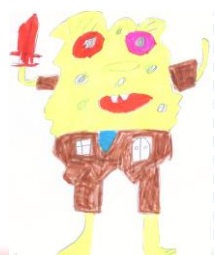
書卡製 一忠 郭宏儀