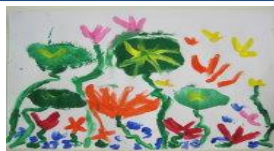
荷花 幼稚園 劉佩欣