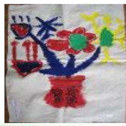
插花 幼稚園 鐘乙如