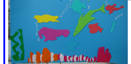
海底世界 一忠 曾佳欣