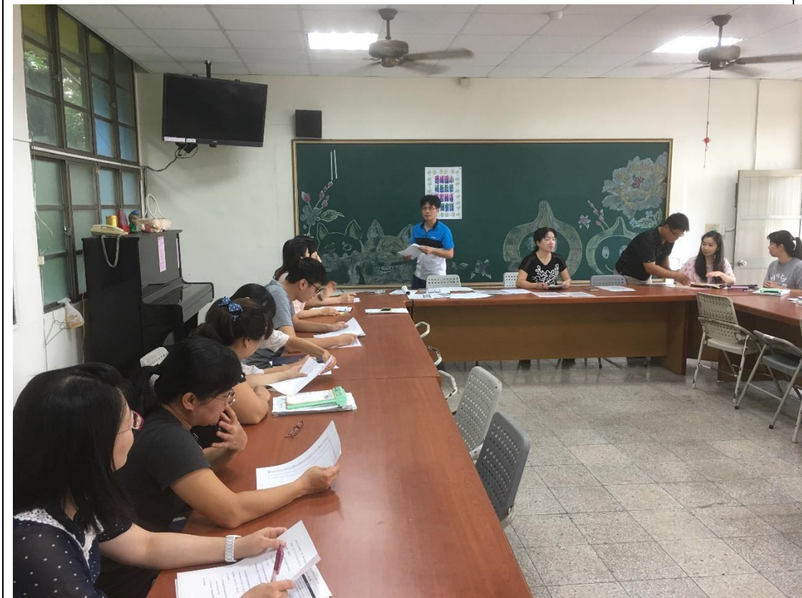
說明：107 學年補救教學學習輔導會議