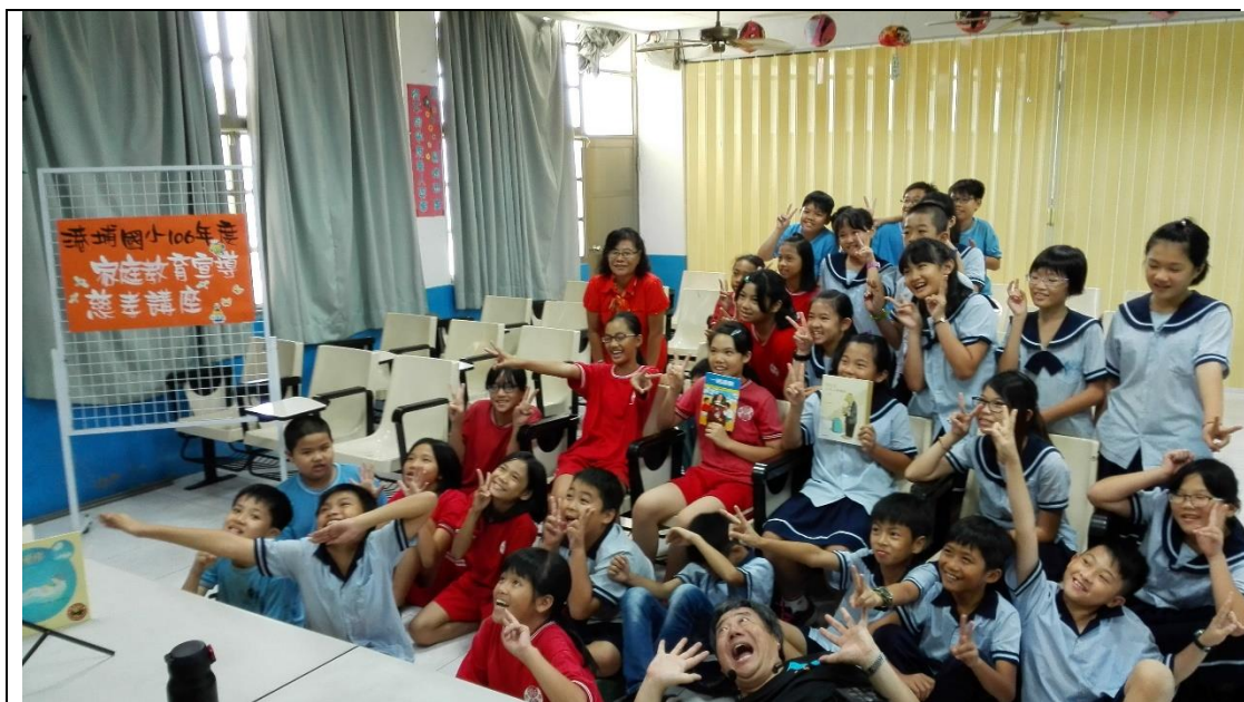
說明：106 學年慈孝教育講座