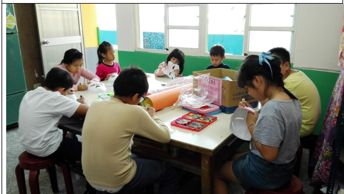
說明：106 學年多元文化小團體輔導課程