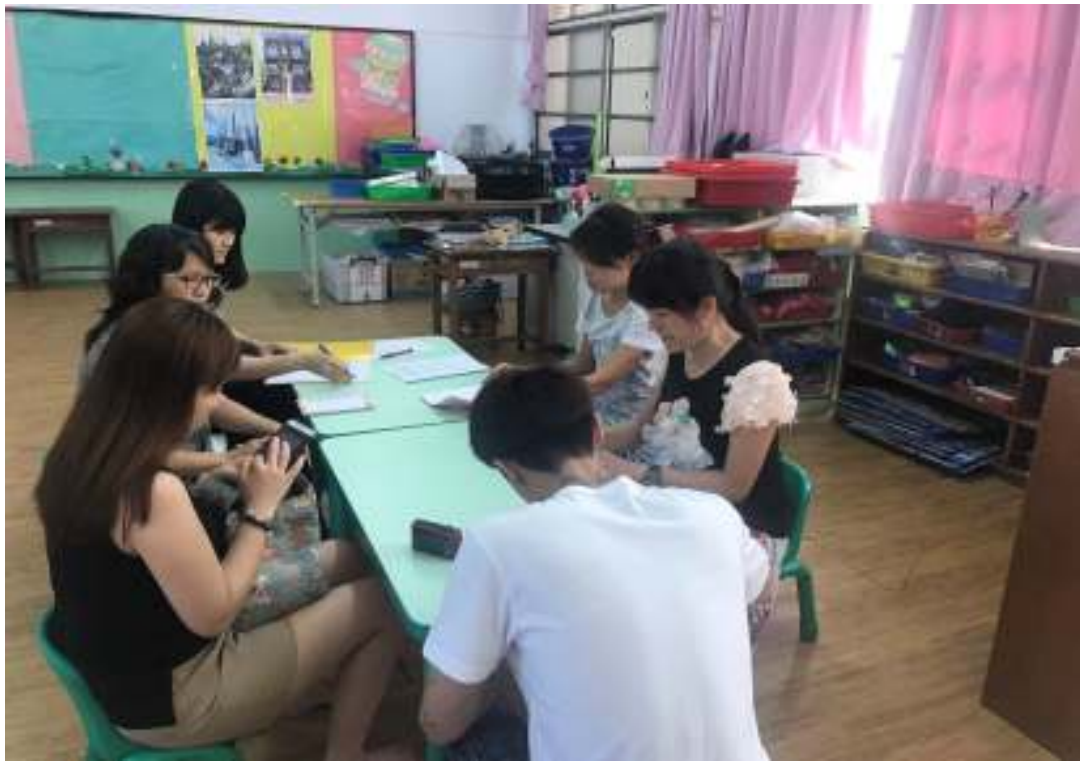
特殊生轉銜會議—針對跨教育階段學生提供轉銜服務