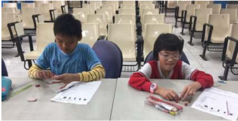
四邊形—牙籤與黏土組合