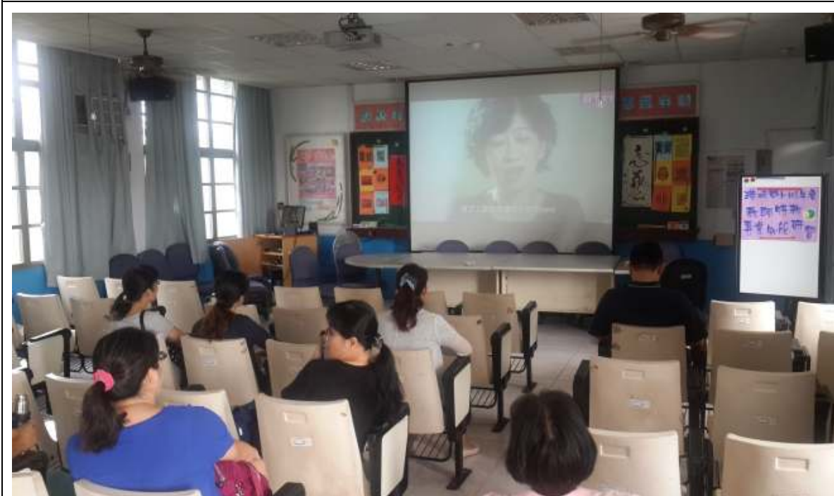
特教研習-增進教師特教知能