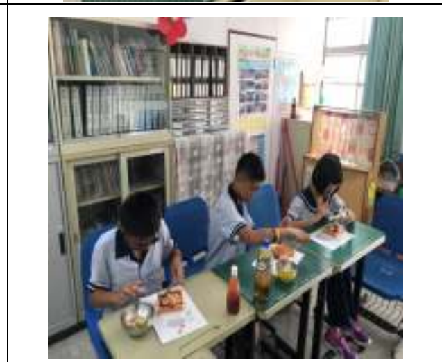
廚藝訓練—麵糊蛋餅、堅果巧克力、吐司披薩