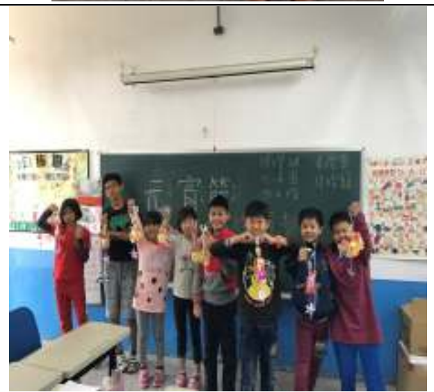
節慶教學-端午節龍舟製作、萬聖節桌遊、母親節感恩明信片、元宵節燈籠製作