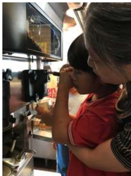
戶外教學-社區麥當勞內場參觀製作體驗