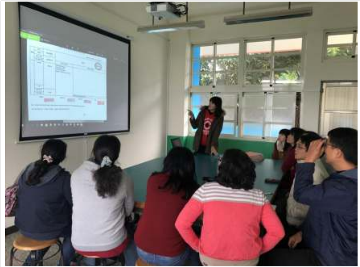
特教推行委員會—討論校內特教業務之推動