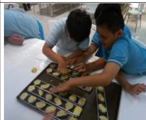
戶外教學-富樂夢文具工廠、紅頂穀創工廠、壽山動物園、黃金菠蘿城堡