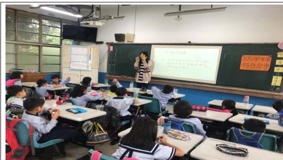
特教宣導-推動有效融合教育