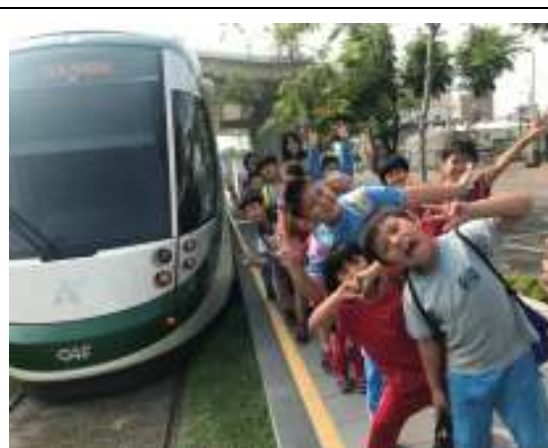
學習搭乘大眾運輸交通工具—公車、捷運、渡輪、輕軌體驗