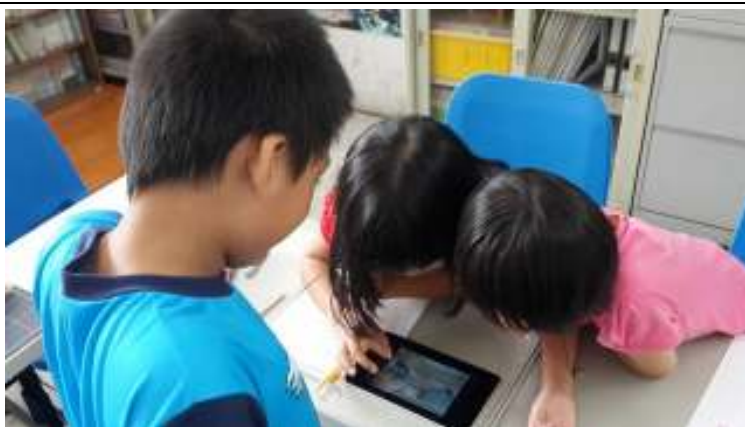
利用平板展示圖片協助語詞理解