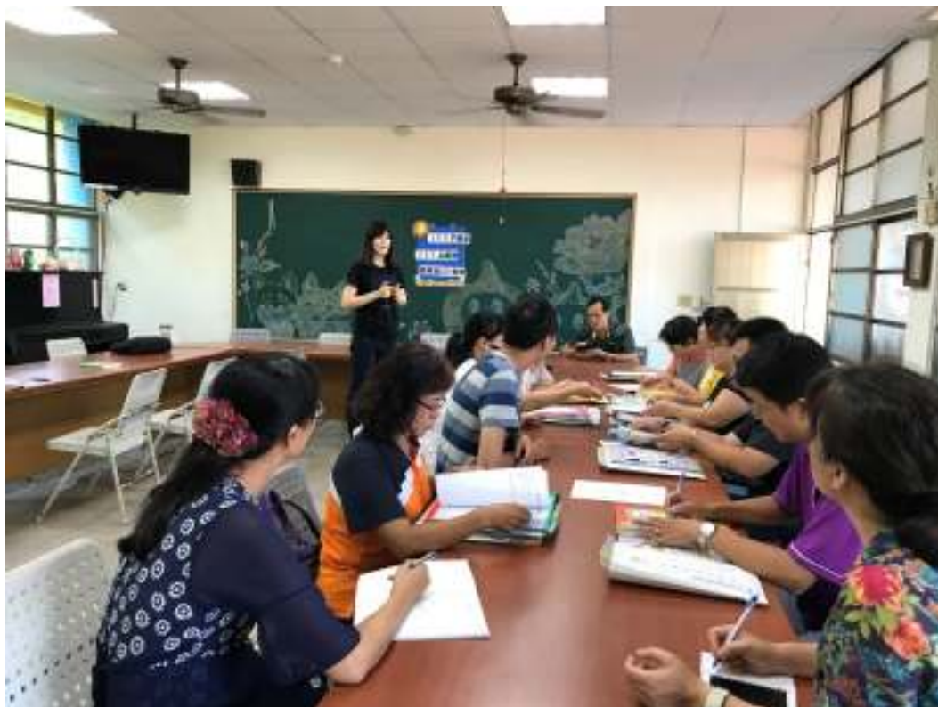
IEP 會議—討論特殊學生學習情形和教學目標