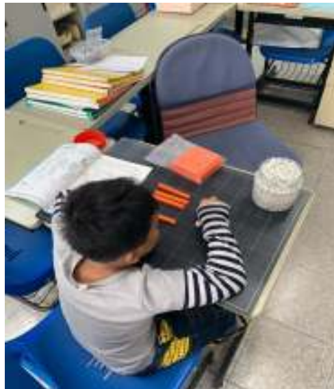
錢幣操作、積木點數協助學習數量