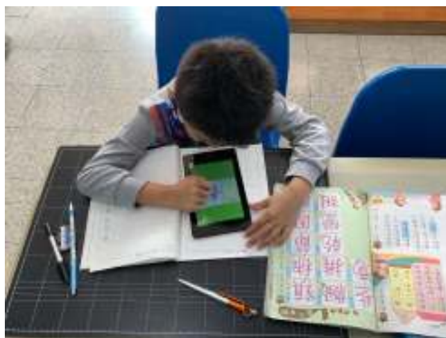
透過筆順 APP 協助學習生字筆順、筆畫