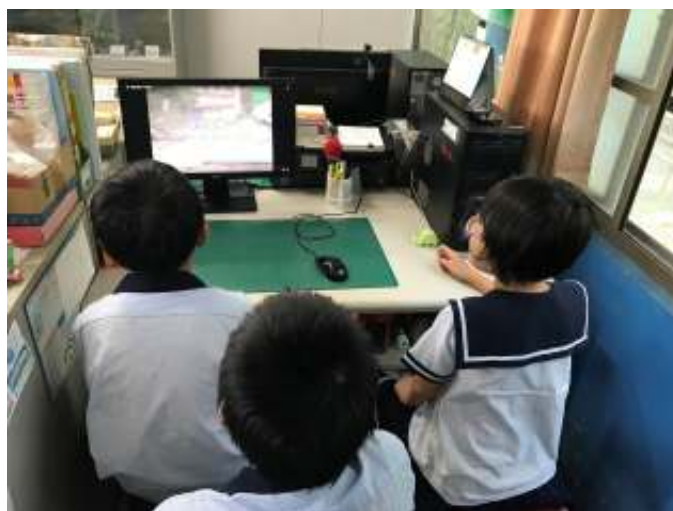
藉由觀看影片協助課文理解