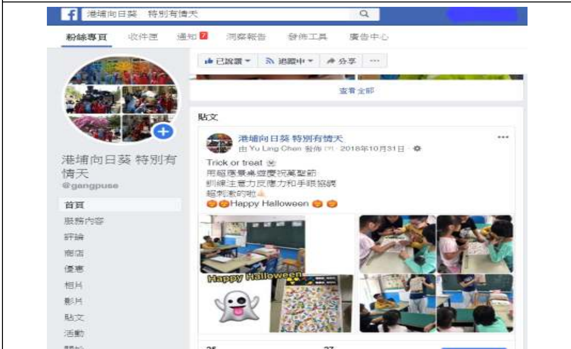
班級臉書-張貼向日葵教室相關教學和學生學習成果