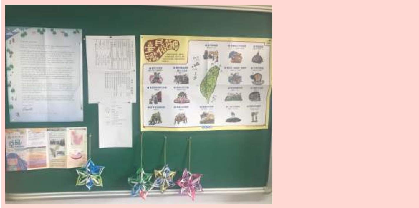
說明 | 學校宣導內容及班級事務公告。