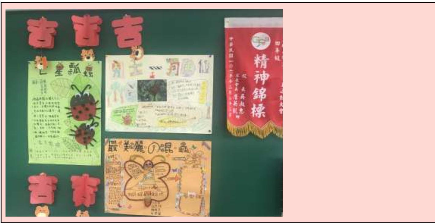
說明 | 學生優良作品展示以供學生瀏覽。