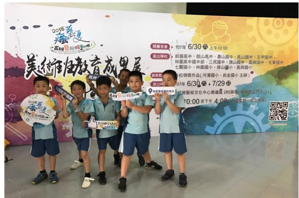
活動會場~參觀民眾(打卡按讚)