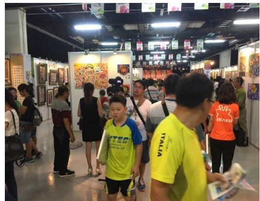
活動會場~參觀民眾