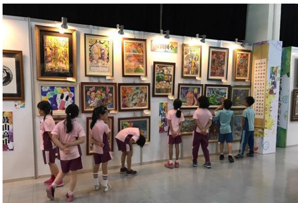
活動會場~參觀民眾(國小校外教學)