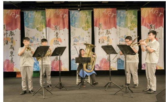
開幕表演~管弦樂器演奏