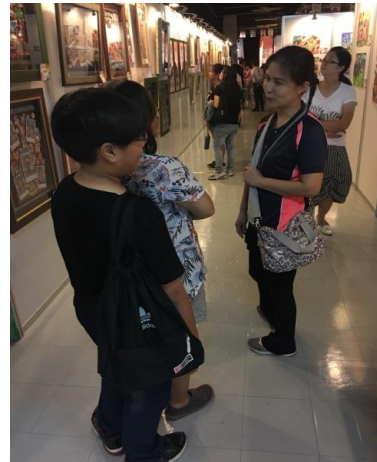
活動會場~參觀民眾