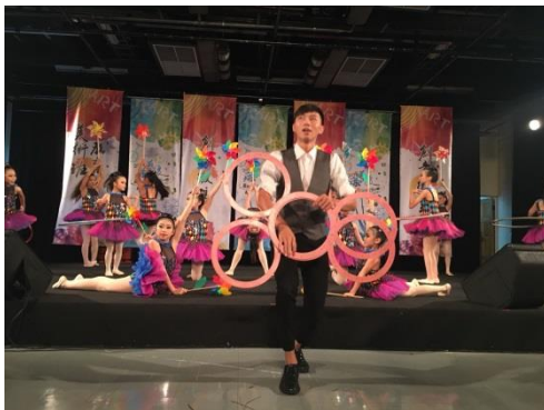
開幕表演~藝起轉動~舞蹈表演