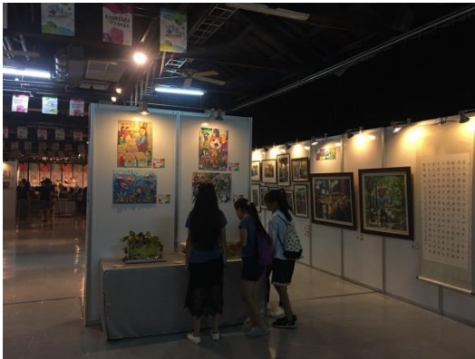
活動會場~參觀民眾