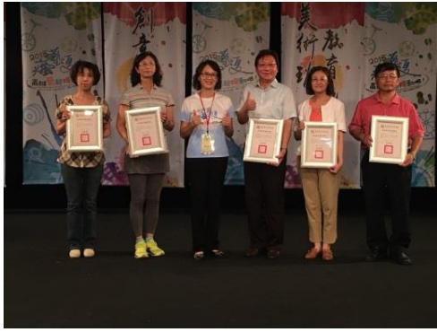
美術教育推展學校授獎