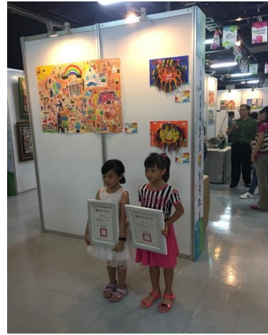
活動會場~參觀民眾