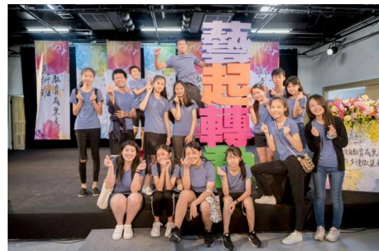
活動會場~藝才班學校參訪和分享