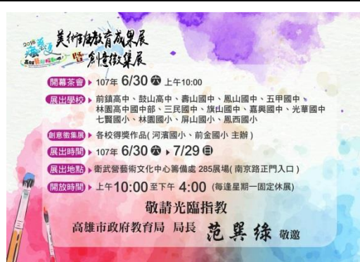
美術班教育成果展邀請卡（背面）