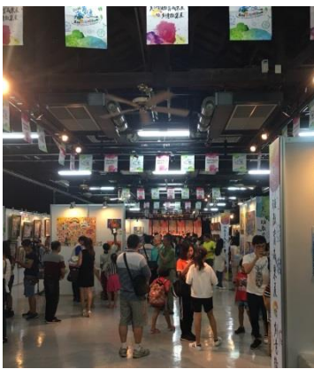
活動會場~參觀民眾