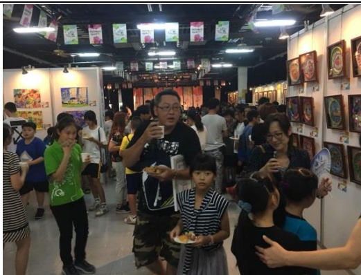
活動會場~參觀民眾