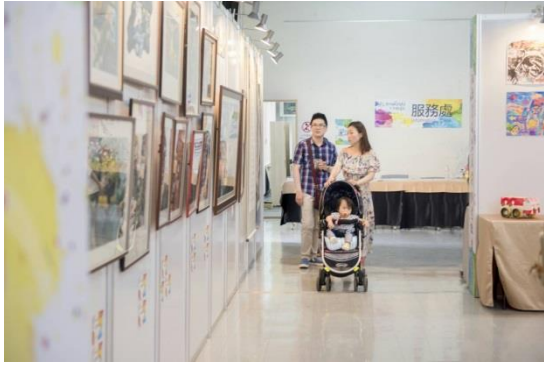
活動會場~參觀民眾