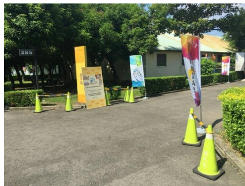
活動方向指引, 旗幟宣傳