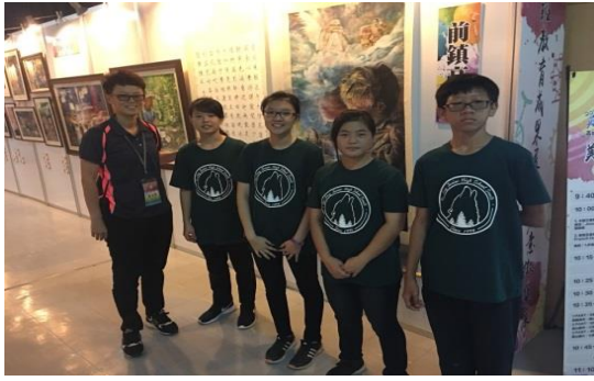
藝才班學生擔任展場志工