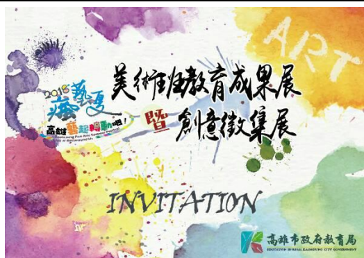
美術班教育成果展邀請卡（正面）