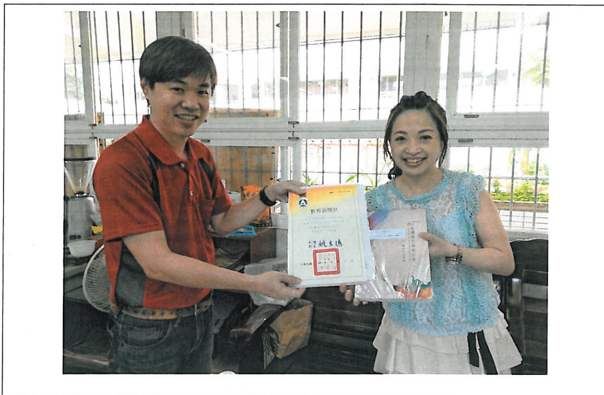
活動內容說明： 下學期第 3 次藝術才能班教學研究會議