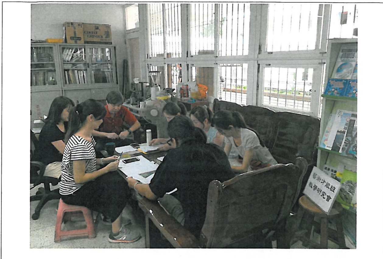
活動內容說明： 下學期第 3 次藝術才能班教學研究會議