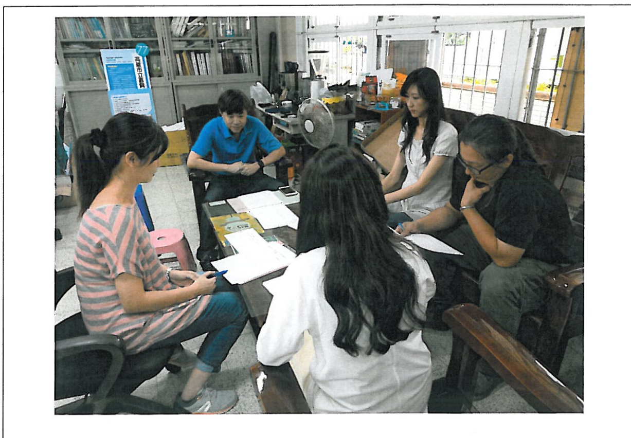
活動內容說明： 下學期第 2 次藝術才能班教學研究會議