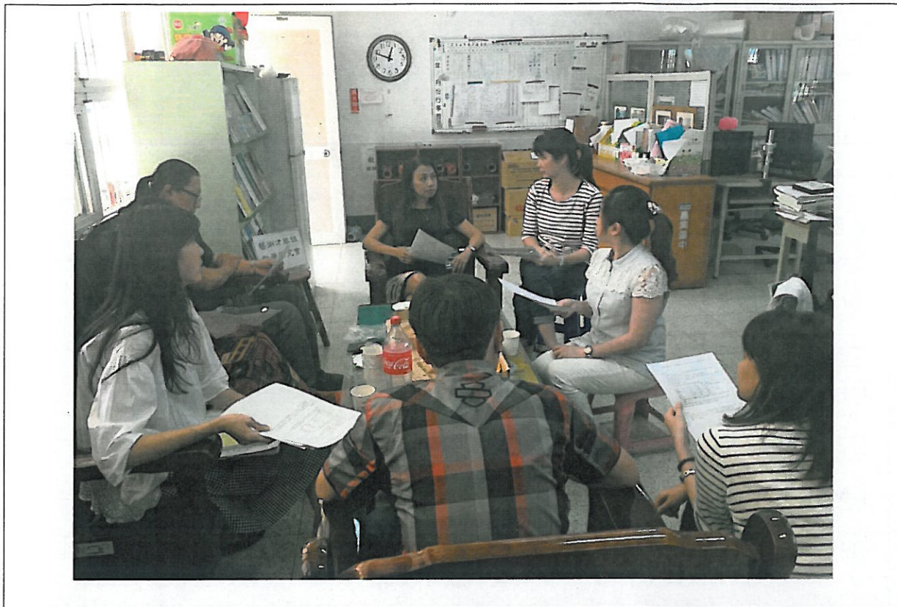
活動內容說明：下學期第 1 次藝術才能班教學研究會議