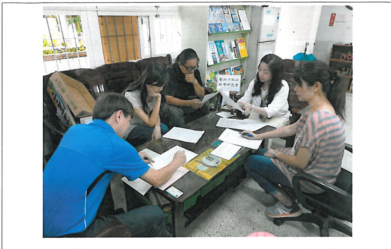
活動內容說明： 下學期第 2 次藝術才能班教學研究會議