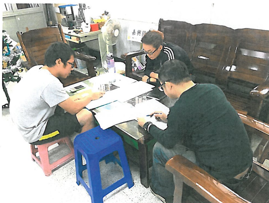
說明：107.12.19 107 學年度第一學期健體領域第三次教學研究會 教學議題討論