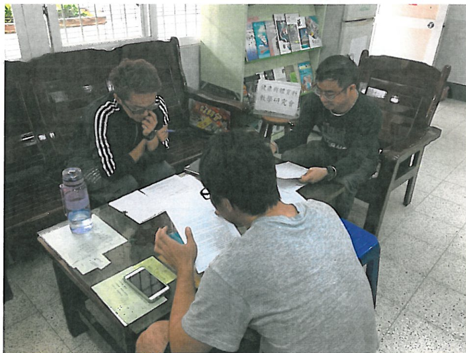
說明：107.12.19 107 學年度第一學期健體領域第三次教學研究會 教學議題討論