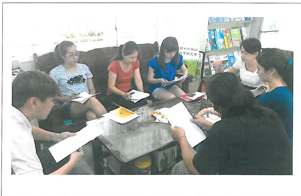
活動內容說明： 上學期第 1 次藝術才能班教學研究會議