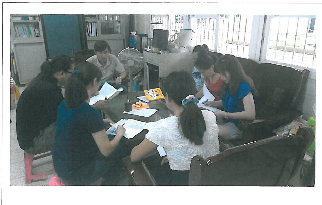
活動內容說明： 上學期第 1 次藝術才能班教學研究會議