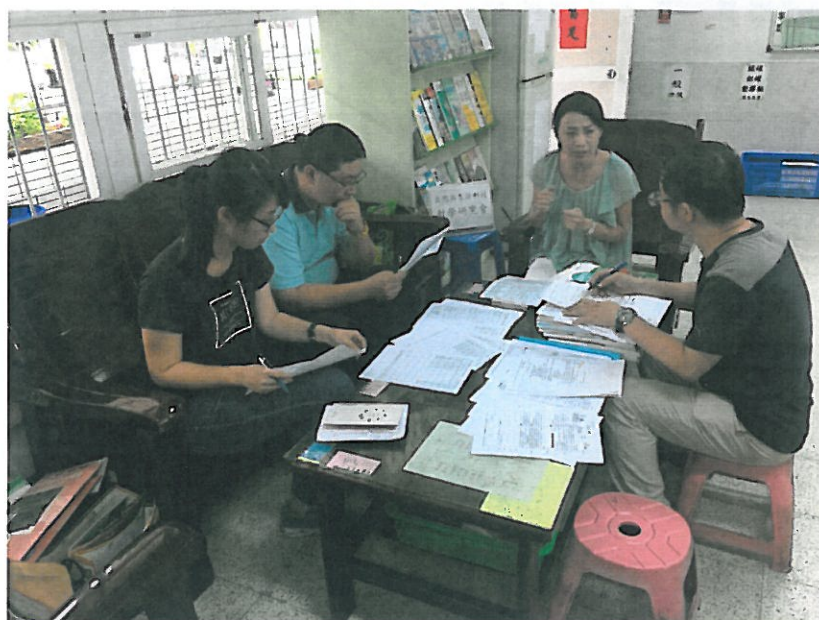
說明：107.05.24 106 學年度第二學期自然領域期末教學研究會