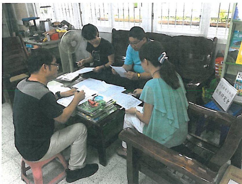
說明：107.05.24 自然領域(期末)第三次教學研究會：評選 107 教科書