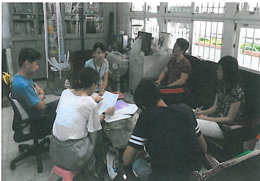
說明：106.11.08 106 學年度第一學期數學領域教學研究會(第二次)