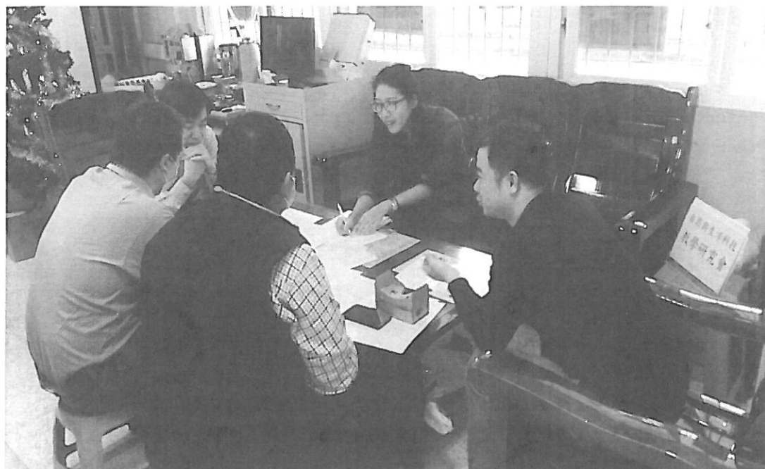
說明：105.12.15 105 學年度第一學期第三次自然領域教學研究會