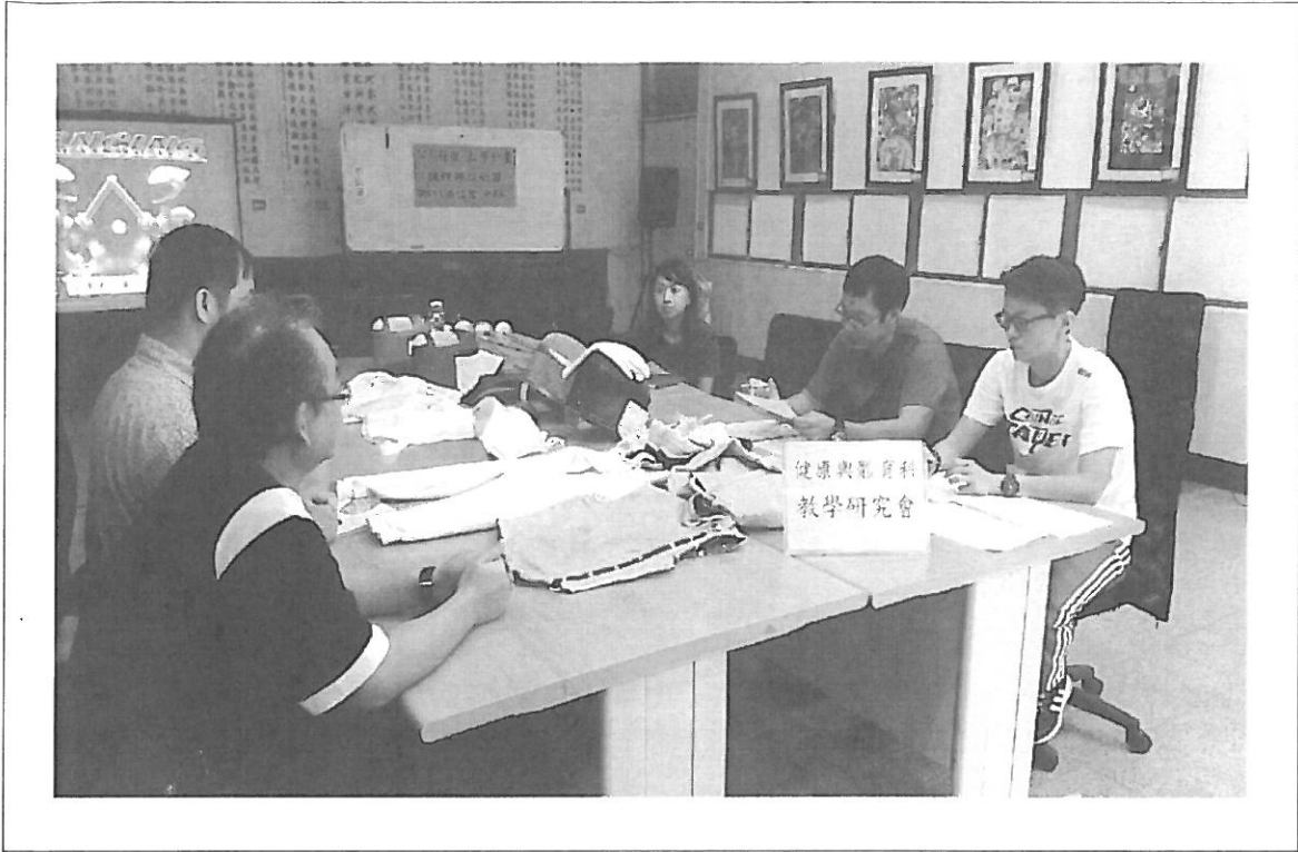
說明：105.12.14 105 學年度第一學期第三次健體領域教學研究會