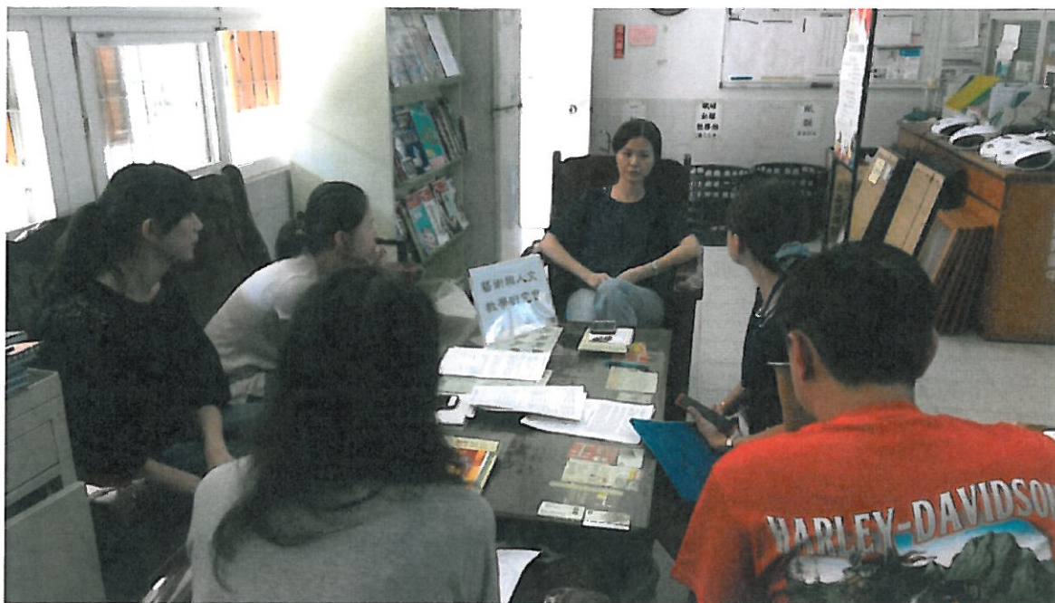
說明：105.11.08 105 學年度第二學期藝文領域教學研究會