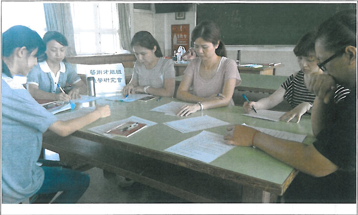
活動內容說明： 下學期第 2 次藝術才能班教學研究會議