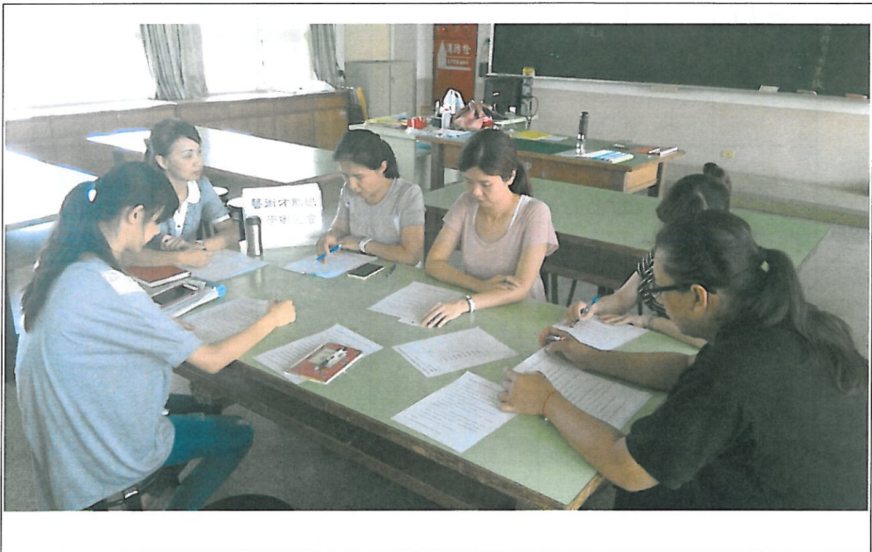
活動內容說明： 下學期第 2 次藝術才能班教學研究會議