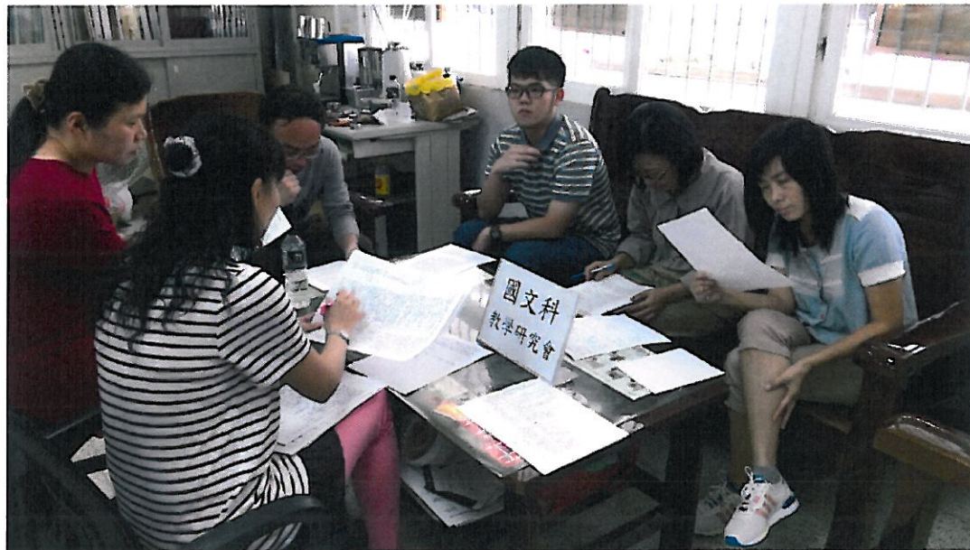
照片 2 說明：105.04.12 段考國文科試題分析