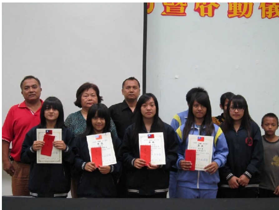
照片十六：布農族語---頒獎暨全體合影。