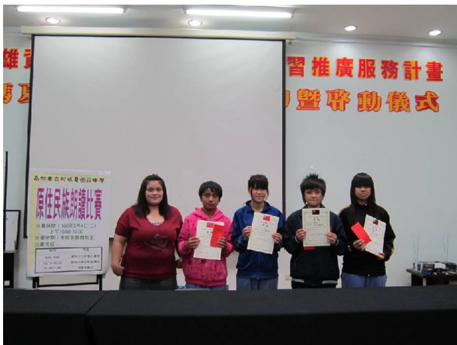
照片四：鄒族(沙阿魯) 語評審和得獎者合影。