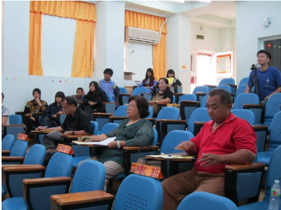
照片十：布農族語比賽台下實況。