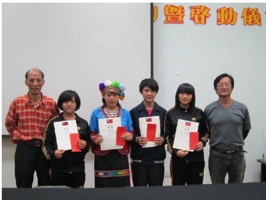
照片八：鄒族(卡那卡那富) 語評審和得獎者合照。