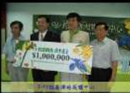
支持推廣淨地保護中心