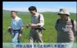
協助人員親自前往自然科學教育