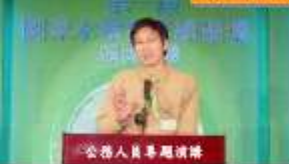
公務人員專題演講