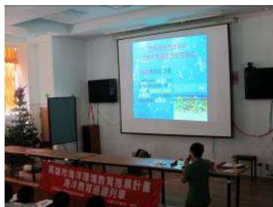
講座——海洋環境教育