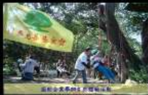
協助企業舉辦戶外環保活動