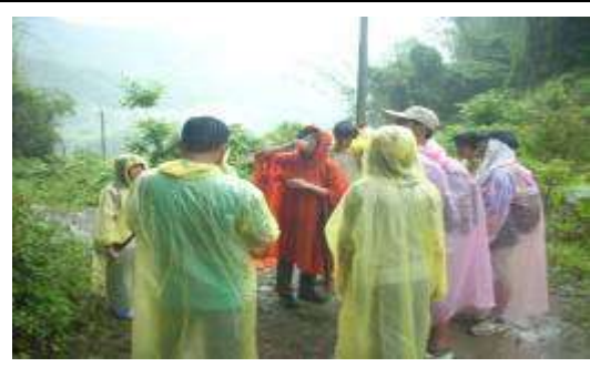
課外活動——悟洞野外植物觀察