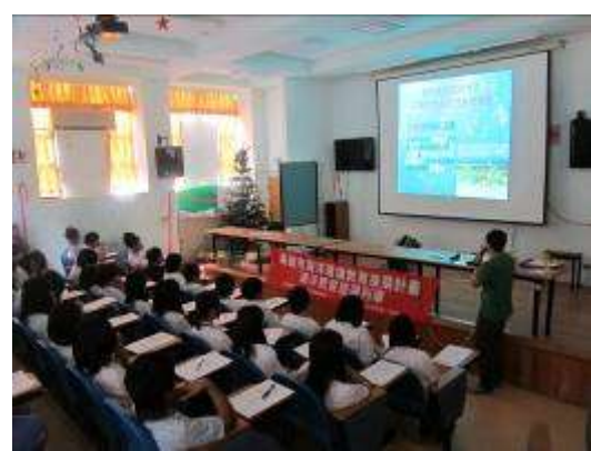
講座——海洋環境教育