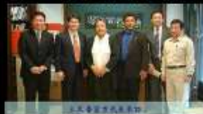
出席重要正式場合活動