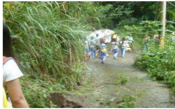
那瑪夏任務卡—學生實地採集