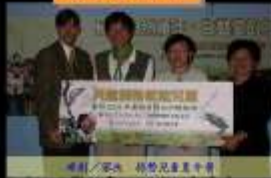
順利 / 家地 協助兒童夏令營