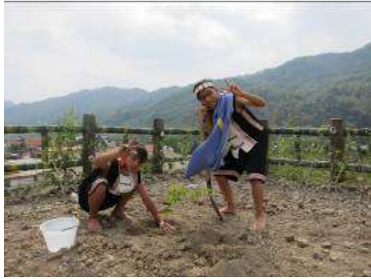
環境教育——植樹活動