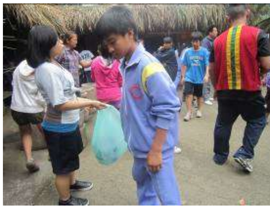
環保融入生活——祭典後資源回收