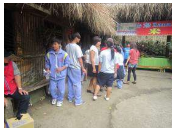
環保融入生活——祭典後資源回收