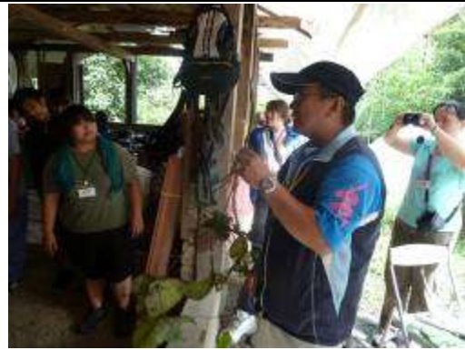
那瑪夏任務卡— 講師講解各類植物