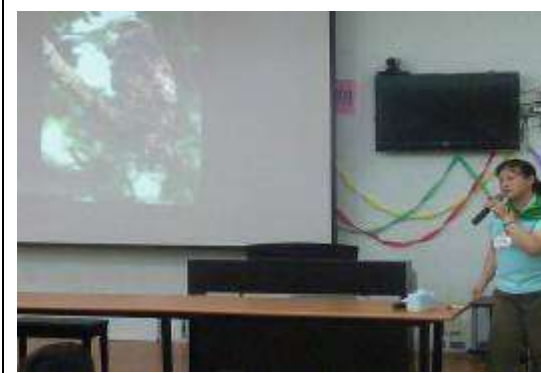
教師講解一與大自然做朋友