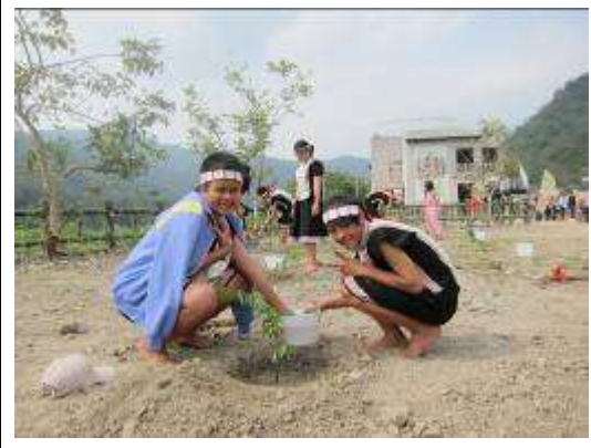
環境教育——植樹活動