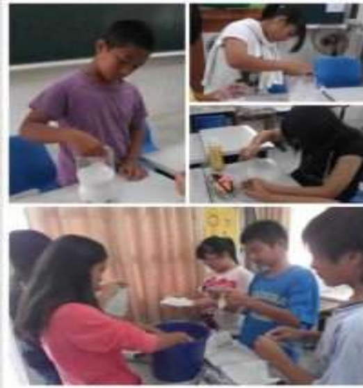
環境教育—再生紙製作