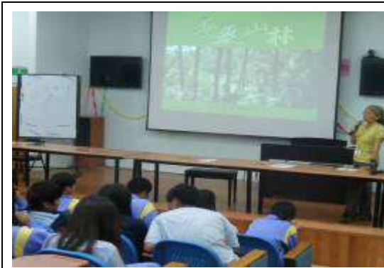
教師講解一無痕山林