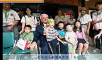
與世界接軌，分享環保經驗，提昇參與決策的影響層次