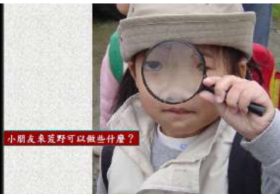
推廣綠色生活故事