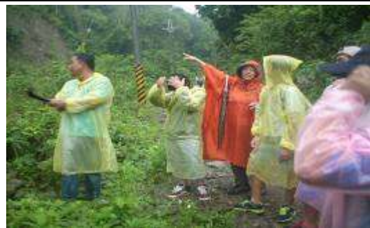
課外活動——悟洞野外植物觀察