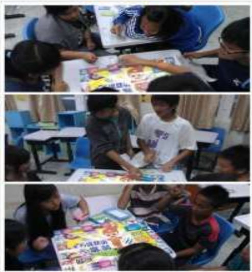
環境教育—土石流大富翁