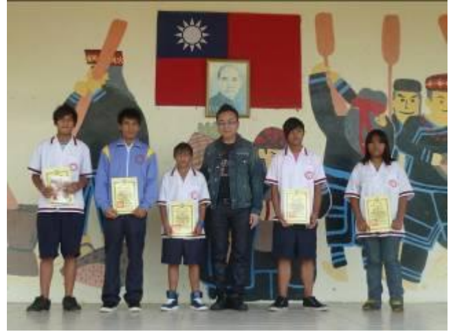
說明：表現優異的學生進行頒獎