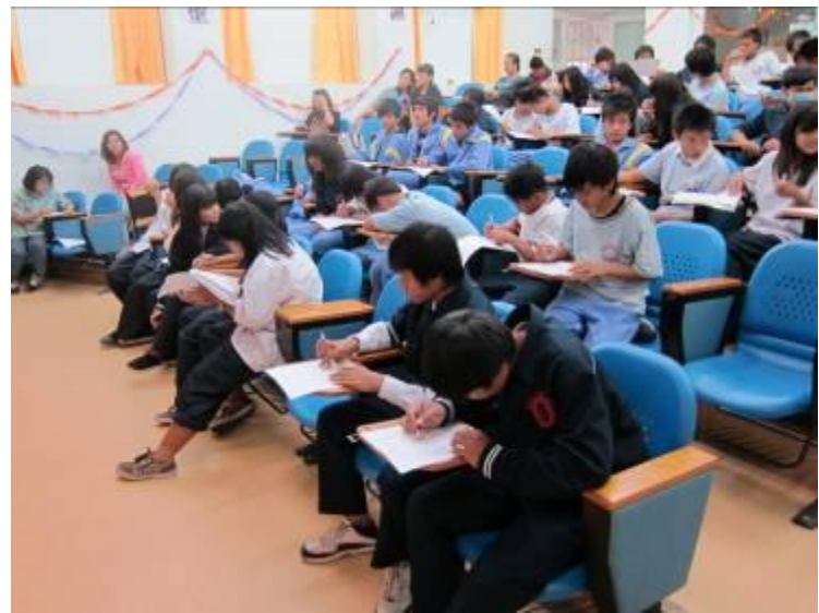
說明：衛生所進行菸害宣導並填寫問卷