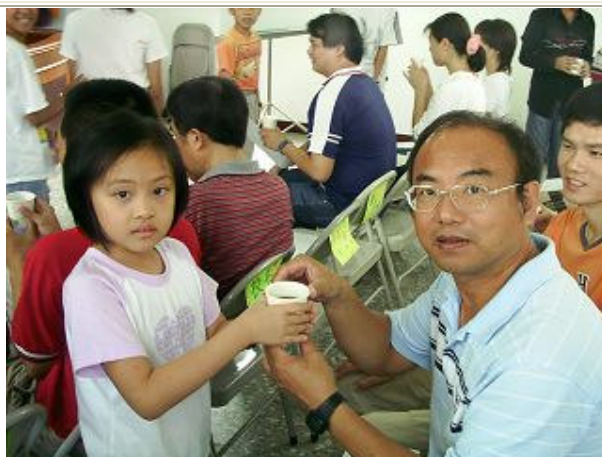
小朋友奉茶，慰勞老師之辛苦