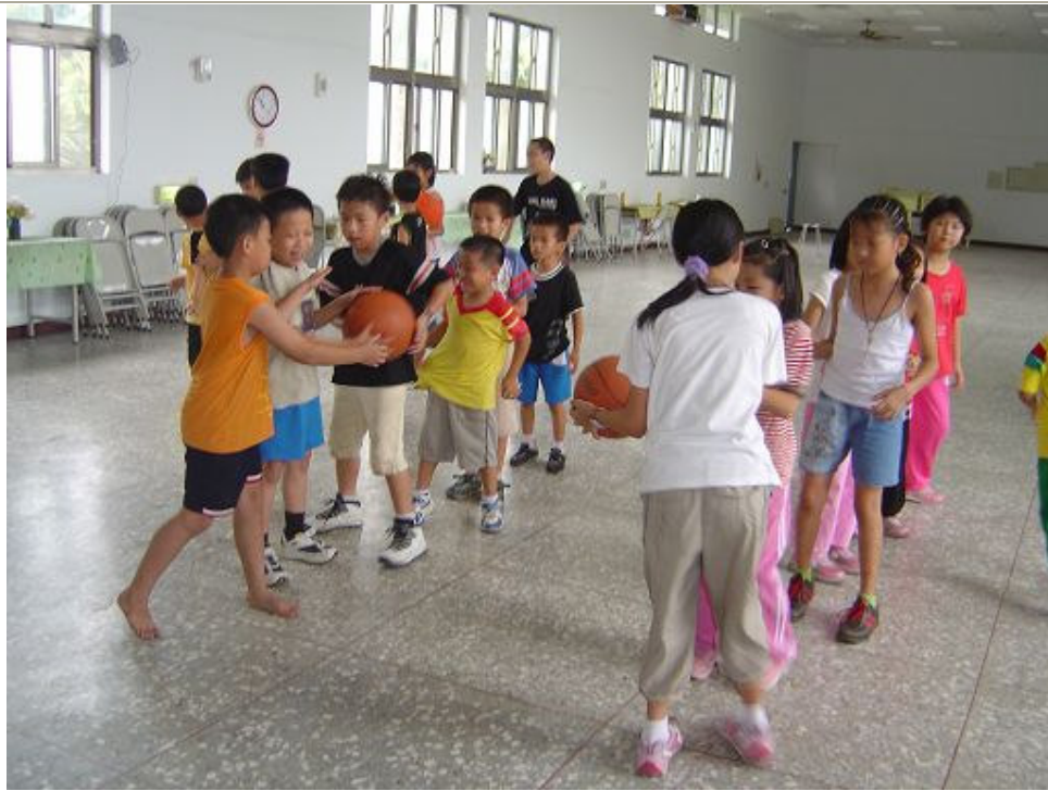
暑期辦理籃球育樂營活動，提升學生運動技能