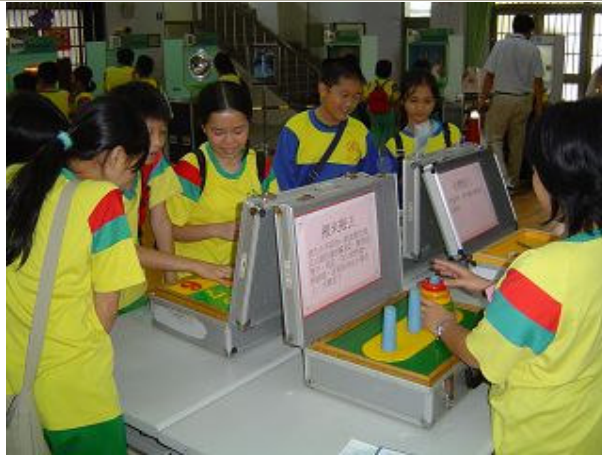
全校學生至朴子國小行動科學館校外教學