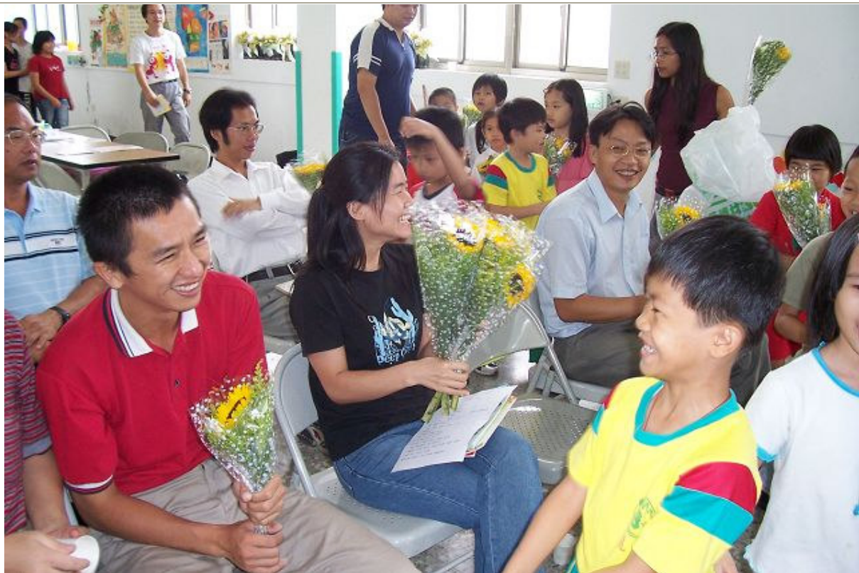
教師節當日，小朋友獻花給老師，聊表感謝之意