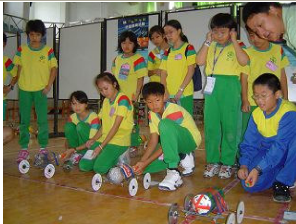
看誰做的車子，跑得最快