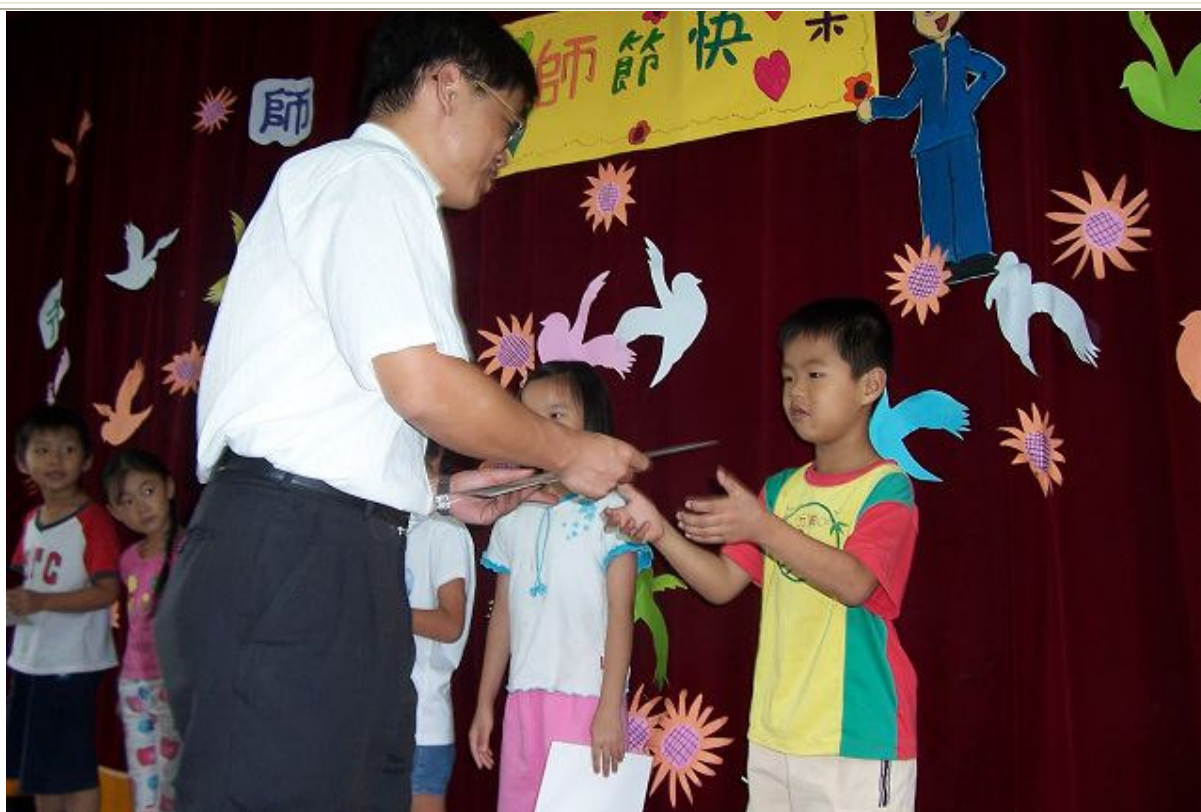
頒發教師節感恩卡設計比賽得獎學生之獎狀