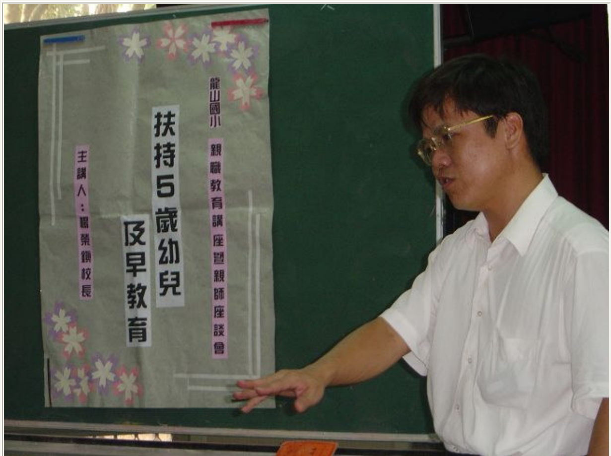
校長擔任幼稚園親職教育講座之講師，暢談幼兒學習與生活照顧