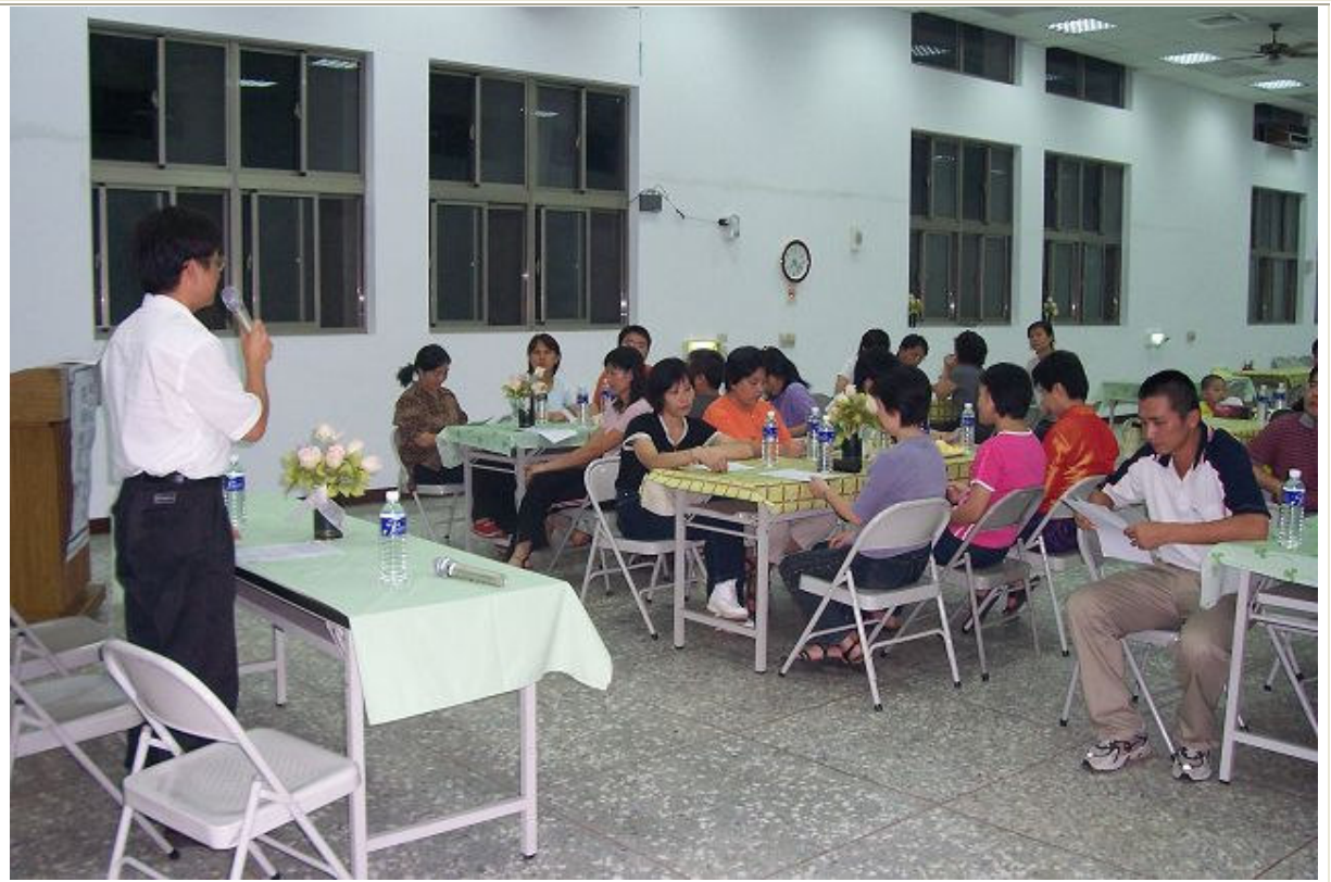
九月八日召開親師座談會，校長向家長說明校務運作及辦學理念