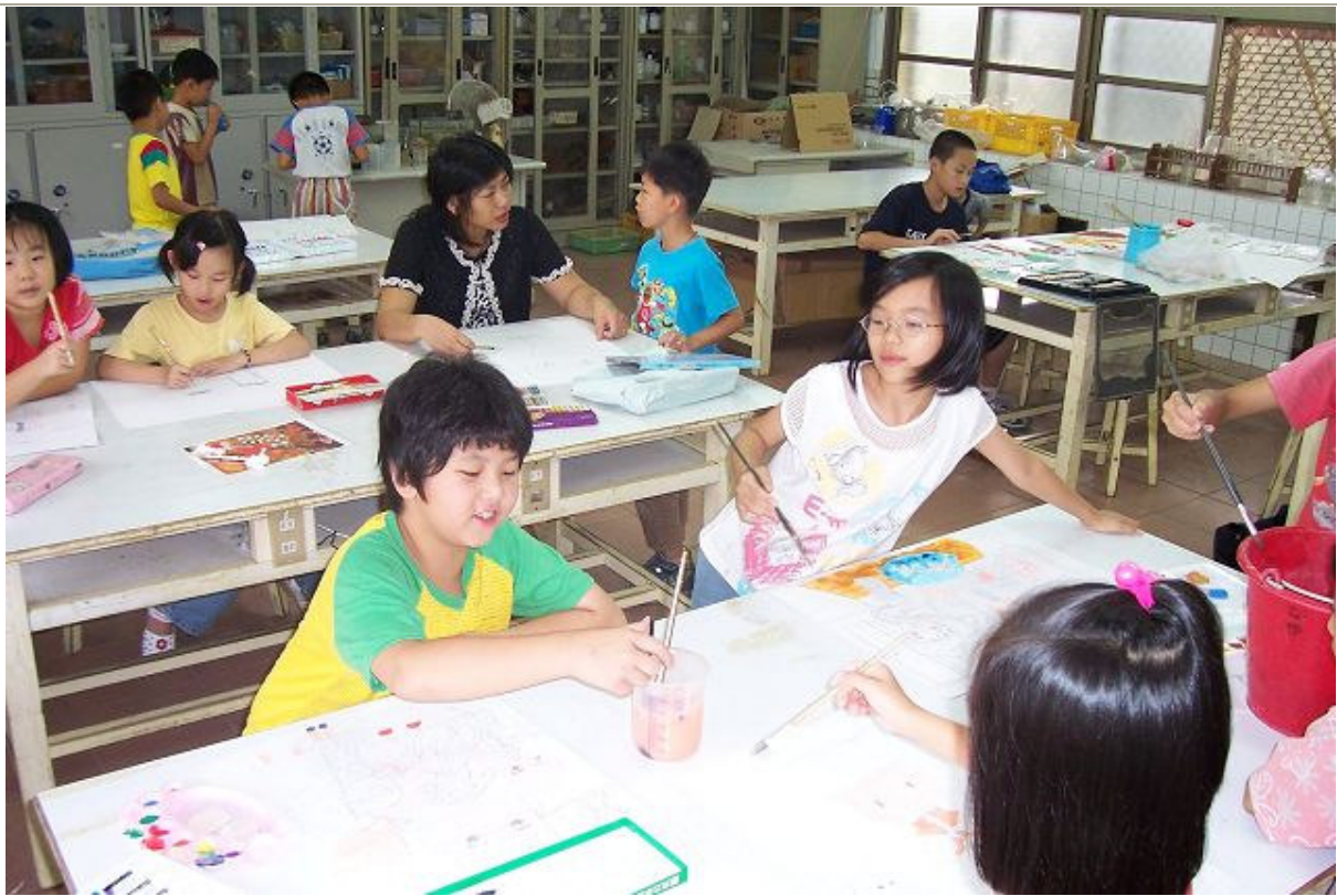
繪畫班學生作畫情形，美學概念及藝術氣質提升不少