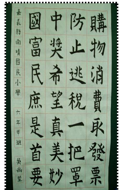
小畫家暨小書法家：